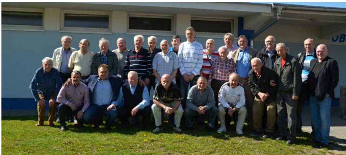
Sraz pamětníků Aston Villy 2017