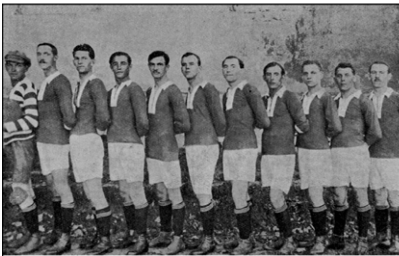
Mužstvo, které vyhrálo mistrovství II. třídy roku 1920

a vzápětí zanikala různá mužstva pro sehrání přátelských utkání (Boleslavan Žižkov, Vinice, Kolonie, Střela Rožátov, Slovan Blesk, Podolec, Staroměstský, Novoměstský a podobně). V květnu 1910 založený Mladoboleslavský SK se přihlásil do řádné soutěže s konkurencí středočeských a pražských mužstev.