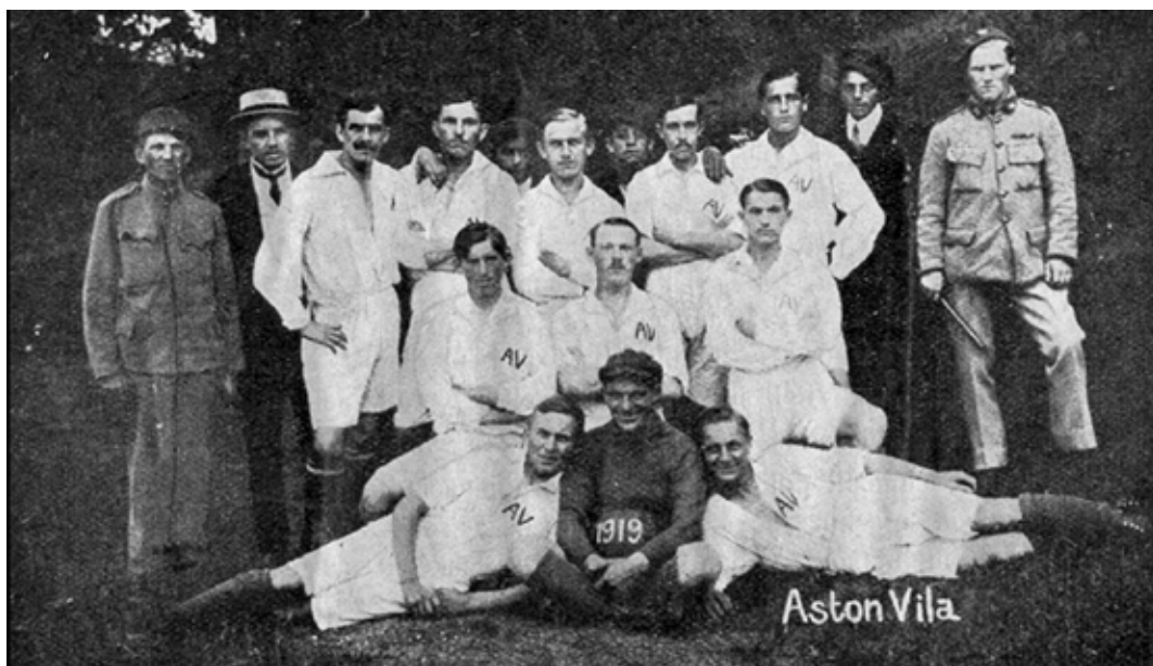
První mužstvo Aston Villa z roku 1919